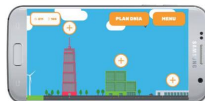
Twoje miasto - częściowo zabudowane

Całość działa bardzo intuicyjnie, w systemie nawigacji zastosowano sprawdzone rozwiązania komunikacyjne (język korzyści, przypomnienia w kontekście możliwych do pozyskania punktów i monet, motywujące wizualizacje) i czytelne, miłe dla oka grafiki. Pojawiają się elementy gry, które mają wzmacniać poprawne nawyki użytkowników. Plan dnia, w którym można śledzić postępy w realizacji codziennych wyzwań i zapisywać informacje o zjedzonych warzywach i owocach, wypitej wodzie czy aktywności fizycznej. Zdrowe zachowania (codzienne/regularne jedzenie warzyw i owoców, picie wody i uprawianie sportu) zawsze premiowane są podwójnie: pochwałą i ... nagrodą – monetami lub punktami energii. Dzieci zdobywają je potwierdzając realizację pożądaných aktywności w aplikacji i zyskują elementy niezbędne do budowy stworzonego w swojej wyobraźni organizmu miasta. Im więcej poprawnych zachowań, tym więcej możliwości zyskuje gracz.