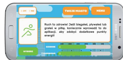
Plan dnia - ruch